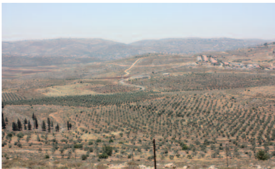
L'industrie des olives en Judée-Samarie remonte aux temps bibliques. Les plantations d'oliviers des Arabes sont totalement anarchiques et éparses, alors que celles des Juifs sont très rigoureuses et compactes.