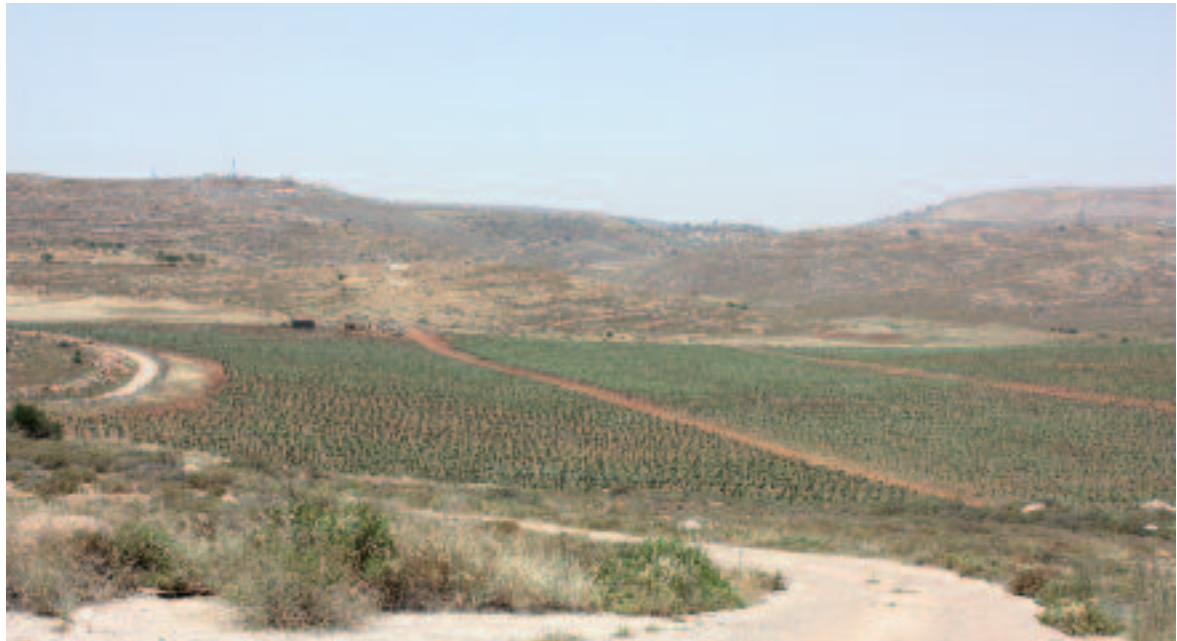
En Judée-Samarie, le manque d'eau favorise la production du raisin.

an. Les producteurs ont limité leurs productions à 4 ou 5 variétés d'olives, dont les plus importantes sont l'Arbequine, la Picholine, la Picual et la Barnea. Chacune d'elles a son propre caractère (fruité, fort, piquant, doux, etc.) et est adapté aux différents types de plats.