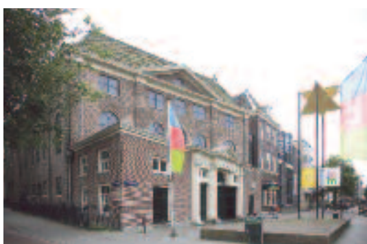
Das Joods Historisch Museum Amsterdam besteht aus vier restaurierten Synagogen mitten im ehemaligen jüdischen Viertel von Amsterdam Waterlooplein.

Weitere historische oder zeitgenössische Themen im Zusammenhang mit der jüdischen Kultur werden in wechselnden Ausstellungen präsentiert. Unter anderem werden die Werke von jüdischen Künstlern oder Fotografen aus den Niederlanden oder anderen Nationen in den Mittelpunkt