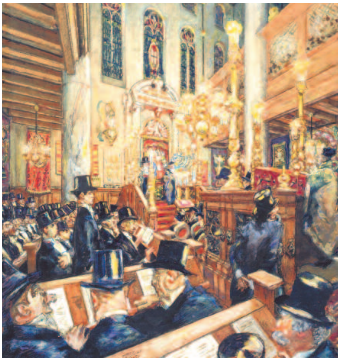
Feierlicher Gottesdienst in der Synagoge. Aquarelle von Martin Monnickendam, Amsterdam 1935, die anlässlich der 300 Jahre der Neederlands-Israëlietische Hoofdsynagoge gemalt wurde. (Leihgabe der NIHS)

in anderen europäischen Ländern dazu, dass sephardische Juden (aus Spanien und Portugal) und aschkenasische Juden (aus Mittel- und Osteuropa) nach Holland einwanderten. Der Integrations- und Emanzipationsprozess dieser unterschiedlichen Kulturgruppen sind das zentrale Thema der Ausstellung. Die Geschichte der Juden in den Niederlanden, 1900 bis heute wird auf der Galerie der Neuen Synagoge durch eine Reihe von Gegenständen und Auszügen aus historischen Filmen präsentiert. Die wichtigsten Entwicklungen sind um 15 Themen herum gruppiert und in drei Zeitabschnitte aufgeteilt: die Jahre vor dem Krieg, der Zweite Weltkrieg und die Nachkriegszeit bis heute.