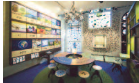
Jüdische Bibliothek und Bildungsraum im Kindermuseum.

gerückt. Empfindliche Werke werden im Saal für Stiche gezeigt, wo auch die Aquarelle von Charlotte Salomon zu bestaunen sind.