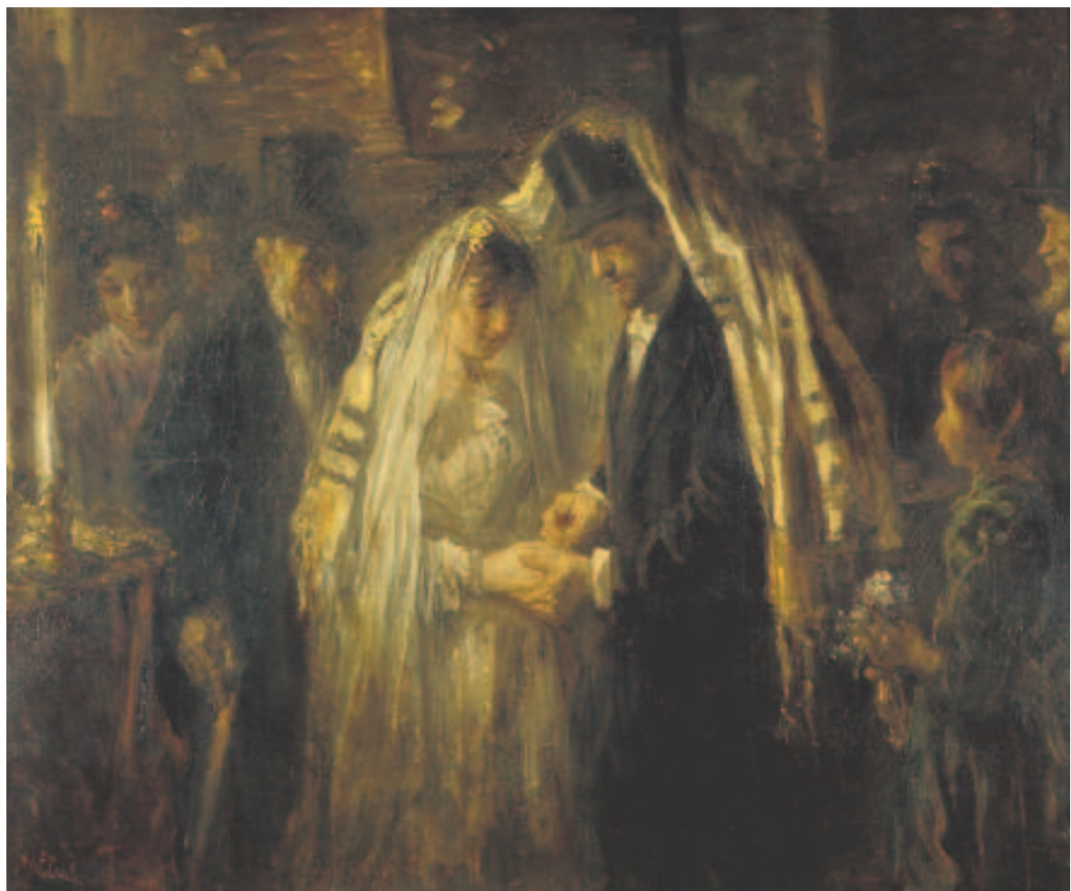
«De joodse Bruiloft » (Die jüdische Hochzeit) von Josef Israëls, 1903. Leihgabe des Rijksmuseum, Amsterdam.