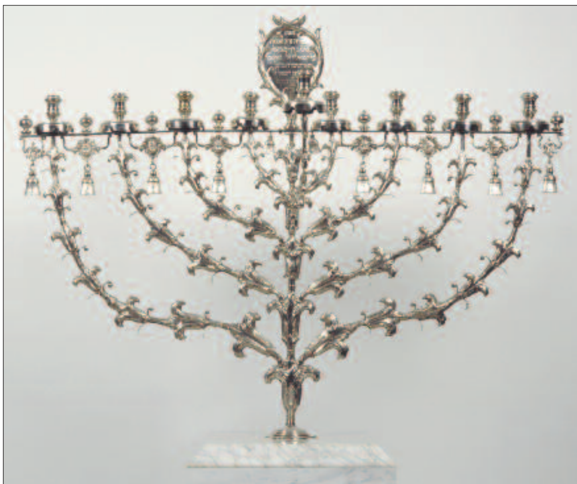
Chanukkahleuchter aus Silber von Pieter Robol II., Amsterdam 1753. Leihgabe der jüdischen Gemeinde Amsterdam (NIHS).

Das Museum hat es sich zum Ziel gesetzt, an den eindrucklichen Beitrag zu erinnern, den die jüdische Gemeinschaft in den 400 Jahren vor der Schoah in unterschiedlichsten Bereichen zum Aufschwung Hollands geleistet hat.