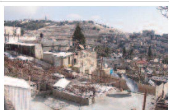
In ganz Israel können die Araber ungehindert alle Fernsehsender empfangen, einschliesslich der Sendungen aus Iran, Libyen, Saudi-Arabien, der Hisbollah und der PLO.

Aus islamischer Sicht ist ein Vertrag, den man mit Ungläubigen abschliesst, nichts weiter als ein Instrument, um einen möglichst grossen Gewinn herauszuschlagen, ohne eine Gegenleistung zu erbringen. Seit der Islam auf der Bühne der Geschichte