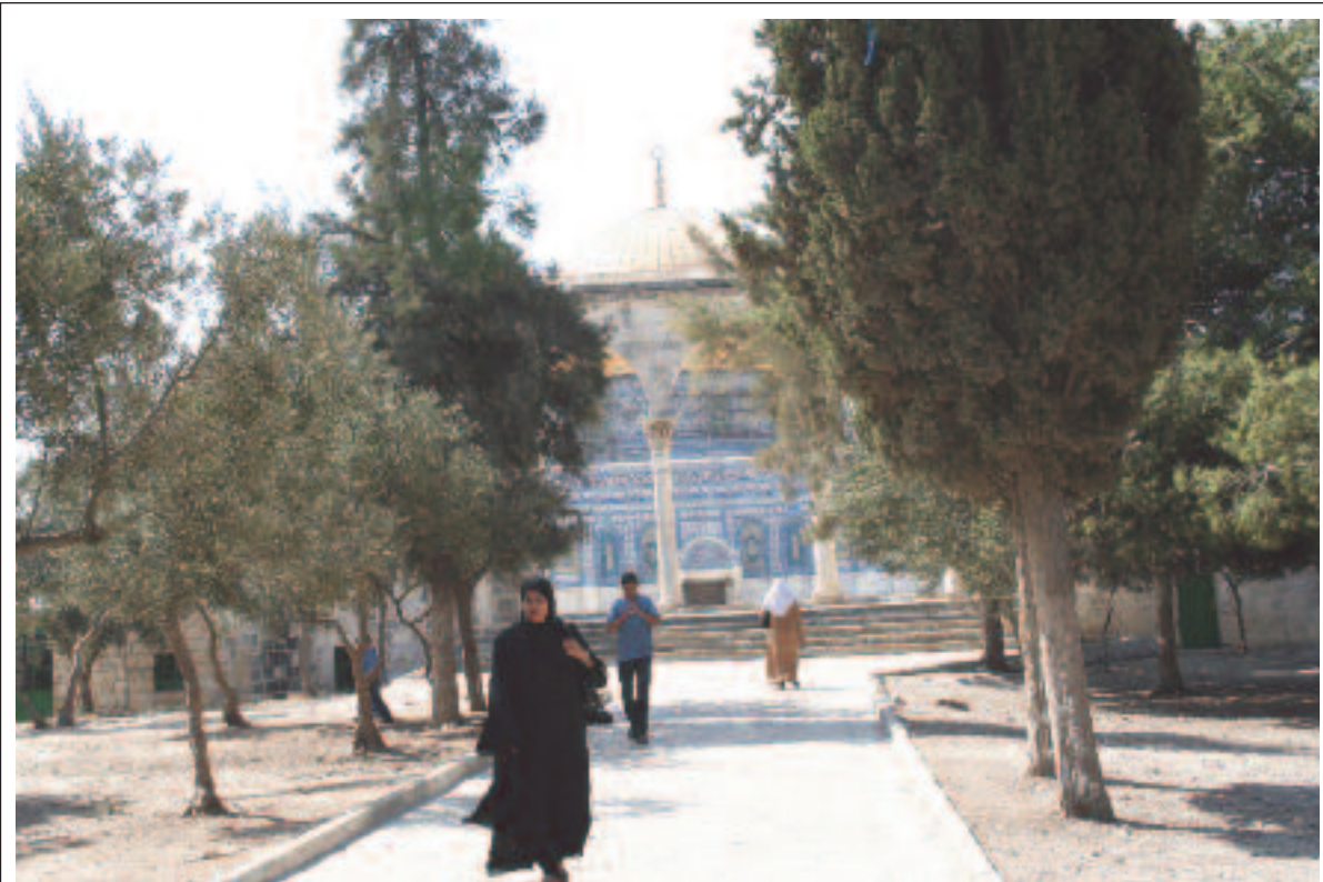
Die israelischen Araber schliessen sich dem Kampf der arabischen Welt an. Ihr Ziel ist die Vernichtung des Staates Israel.