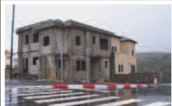
Überall im Land bauen und erweitern die Araber diverse Häuser und Gebäude, ohne sich um eine Baugenehmigung zu kümmern.

besondere in Europa, verharmlost oder ignoriert. Diese unverantwortliche Nachlässigkeit, die bereits zu falschen Entscheidungen geführt hat, ist hauptsächlich auf das fehlende Verständnis der orientalischen Kulturkodes in Israel und im Westen sowie auf die Tatsache zurückzuführen, dass die Menschen im Westen nicht dieselbe Sprache sprechen wie der Islam. Sie sind nicht in der Lage, „als Araber zu denken“ oder „als Perser zu überlegen“. Der Westen schluckt die Lügen der Muslime anstandslos, lässt sich von ihnen manipulieren, verschließt die Augen vor den Drohungen und nimmt gleichzeitig ihre Versprechungen ernst und unterliegt ihren Einschüchterungsversuchen. Diese Verleugnung der Realität lässt sich auch dadurch erklären, dass Europa keine Lust mehr auf Auseinandersetzungen hat, wie sie im Zweiten Weltkrieg stattfanden. Wie lautete doch ein beliebtes Schlagwort während des Kalten Kriegs? „Lieber rot als tot“, ein Zeichen der Mutlosigkeit; diese Parole feiert heute in einer neuen Form, „lieber Mekka statt Rom“, fröhliche Urständ. Leider wurde sogar das israelische Denken von dieser gefährlichen Einstellung infiziert. 2005 erklärte der aktuelle Premierminister in den USA: „Wir sind des Siegens müde“.