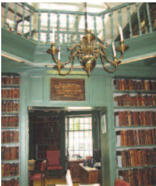
Die Bibliothek Ets Haim wurde vor einigen Jahren von Grund auf renoviert. Im Rahmen eines umfangreichen Restaurierungsprogramms hat man 560 Manuskripte und 800 Druckerzeugnisse aufgefrischt.

Esnoga und der Ets Haim kostbare Präsente zu überreichen. Den Reichtum dieser Bibliothek kann man am besten beschreiben, indem man