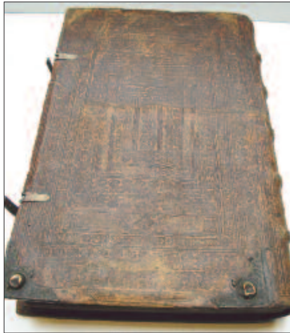
Die Bibliothek besitzt eine umfangreiche Sammlung von Büchern mit herrlichen alten Einbänden.

Esnoga und der Ets Haim kostbare Präsente zu überreichen. Den Reichtum dieser Bibliothek kann man am besten beschreiben, indem man