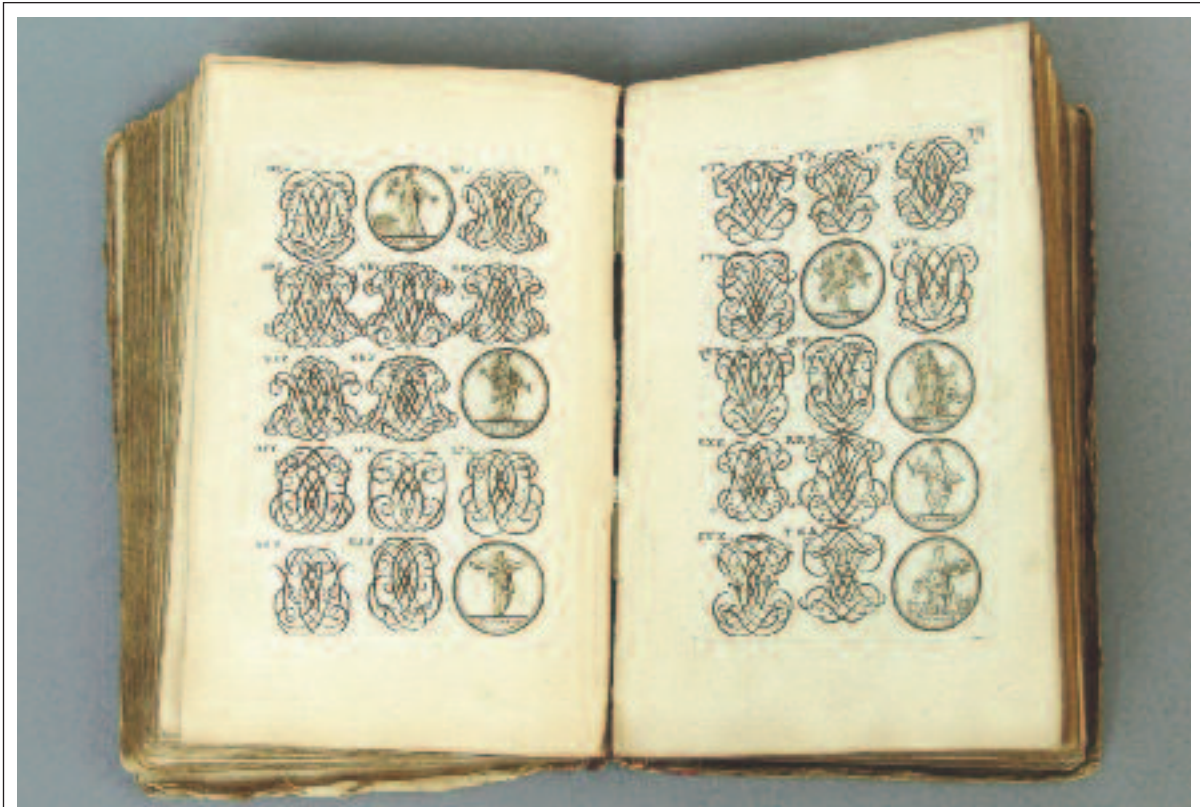
Katalog von Emblemen, Leitsprüchen, Wappen und Monogrammen aus dem Jahr 1696 von Jean Jombert. Die sephardischen Familien besaßen ein eigenes Wappen, auch wenn sie nicht zur Aristokratie gehörten. Ausserdem wurden viele Juden nach ihrer Konvertierung von adligen Familien in Spanien adoptiert und erhielten das Recht, deren Wappen zu benutzen.