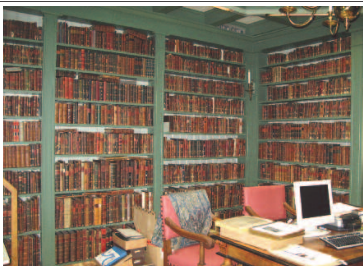
Die Bibliothek Ets Haim – Livraria Montezinos ist die älteste jüdische Bibliothek der Welt und wird regelmässig konsultiert.

Sammlung eingehen, muss daran erinnert werden, dass sie während des Kriegs von den Deutschen gestohlen, später von den amerikanischen Streitkräften wieder gefunden und nach Amsterdam zurück gebracht wurde, wo sie 1946 fast vollständig ihren ursprünglichen Besitzern übergeben wurde.