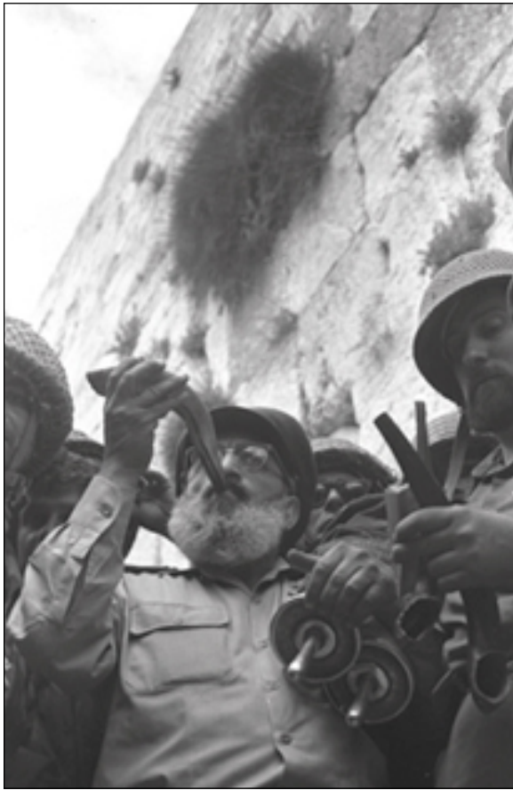
Jérusalem, le 7 juin 1967: l'aumônier en chef de Tsahal, le rabbin Shlomo Goren, entouré des libérateurs, sonne le Shofar devant le Mur des Lamentations.