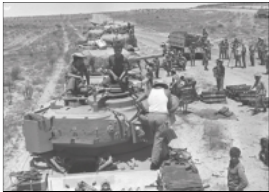
Des tankistes israéliens se préparent en vue de l'offensive de terre dans le Sinaï.