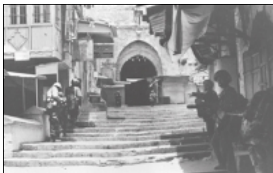
Jérusalem, le 7 juin 1967: des parachutistes israéliens avancent dans les rues désertées de la Vieille Ville.

autre, à la conclusion que l'OLP était le bon interlocuteur. Souvenons-nous que les négociations d'Oslo étaient menées secrètement par Shimon Peres et son équipe, alors que des négociations officielles se tenaient à Washington entre des représentants israéliens et une délégation jordano-palestinienne. Ces pourparlers étaient en fait la continuation de la conférence de Madrid. Les Accords d'Oslo n'ont finalement contribué en rien à l'amélioration de l'image d'Israël en tant qu'État «opresseur». Aujourd'hui, de plus en plus de personnes estiment que ces accords étaient une grave erreur et qu'il était faux d'avoir laissé Arafat revenir de Tunis.