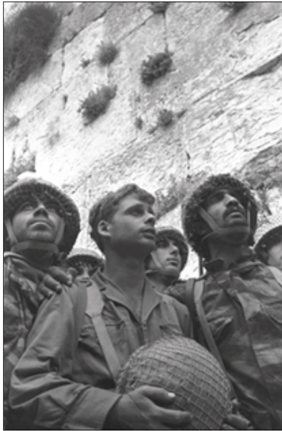
Jérusalem, le 7 juin 1967: les premiers parachutistes israéliens arrivent émus et bouleversés au Kotel Hamaaravi libéré.

de durs combats, les forces d'Israël étaient solidement installées à 100 km du Caire et à 40 km de Damas. L'Égypte et la Syrie ont alors demandé le cessez-le-feu, mais ont toujours refusé de capituler. Aujourd'hui, cette guerre est présentée comme une victoire dans ces pays. En ce qui concerne la dernière guerre du Liban, la perception est que le Hezbollah a gagné la guerre, puisqu'au dernier jour du conflit il a encore tiré 250 roquettes sur Israël alors qu'un million et quart d'Israéliens se terraient dans leurs abris et étaient forcés de quitter leurs foyers. Le monde arabe estime donc que Nassrallah a gagné cette guerre. Or les raisons pour lesquelles le Hezbollah n'a pas été anéanti sont uniquement dues au fait qu'Israël a géré cette guerre en dépit du bon sens. Le gouvernement a refusé d'entreprendre la seule action qui s'imposait et qui était de lancer une offensive terrestre d'envergure. Aujourd'hui, nous avons fait un grand pas en arrière, car les États arabes qui, depuis la guerre du Kippour craignaient de s'attaquer à nous, estiment qu'il n'est plus tout à fait impossible de battre Israël et son armée. Depuis peu, nous entendons d'ailleurs le président Assad dire que