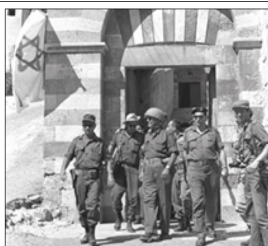
Le 8 juin 1967: libération de Hébron. Le ministre de la Défense Moshé Dayan, entouré des généraux Uzi Narkis et Rechavam Zeevi (Ghandi) à l'entrée du Tombeau des patriarches.

quoi Israël ne s'est pas préoccupé sérieusement de ce problème. En politique, il y a une vieille théorie qui veut que l'on règle d'abord ce qui est urgent et ensuite ce qui est important. Il n'y avait aucune urgence: la population ne posait aucune difficulté, il n'y avait pas d'Intifada ni aucune raison objective