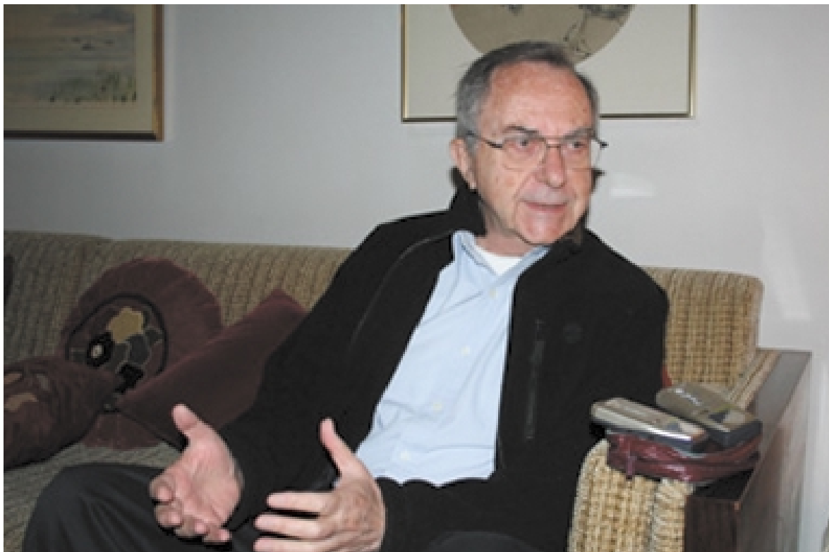
Moshé Arens, ancien ministre de la Défense et ancien ambassadeur d'Israël à Washington.