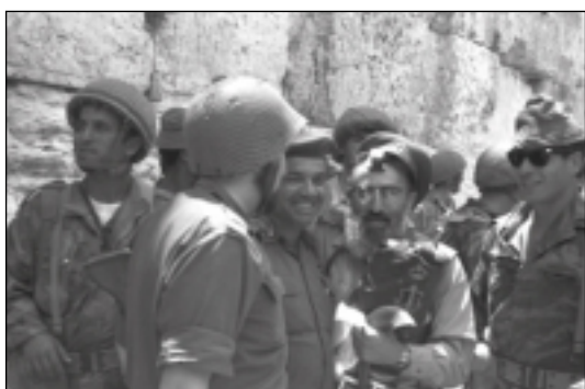
Jérusalem, le 7 juin 1967: le rabbin de l'armée, Rav Shlomo Goren, paré de ses Tefillins (phylactères) et portant une Torah devant le Kotel Hamaaravi. Il est entouré de parachutistes, libérateurs de Jérusalem.

La guerre des Six-Jours a déclenché un changement majeur de la perception d'Israël sur le plan international. L'image de l'État juif est passée de celle d'un petit État insignifiant à celle d'un pouvoir avec lequel il fallait désormais compter. Ceci a été compris en même temps par Washington et Moscou. Soudain, il est devenu clair que ce petit pays, en tout cas du point de vue militaire, était en fait une puissance très significative. Il faut se souvenir que depuis la création de l'État d'Israël, les États-Unis considéraient notre pays comme un fardeau encombrant et non comme un véritable État. Au moment de la création de l'État, de nombreux analystes de la CIA estimaient qu'il n'avait aucune chance de survie. De plus, cette «charge» ne pouvait pas vraiment apporter sa contribution à la défense des intérêts américains et du monde occidental, surtout dans le contexte de la guerre froide face à l'Union soviétique.