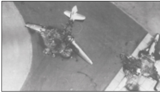
Le 5 juin 1967: attaque d'une base aérienne égyptienne. Destruction d'un avion militaire au sol par l'aviation israélienne.

de prendre les choses en mains, ce qui rétrospectivement était évidemment une erreur. De plus, Menachem Begin et certains membres de son gouvernement estimaient que la Judée, la Samarie et Gaza étant partie intégrante d'Israël, elles seraient à un moment donné incorporées au pays.