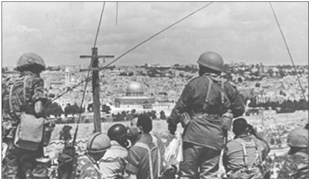
Jérusalem, le 7 juin 1967: juste avant de lancer l'offensive pour libérer la Vieille Ville, le général Motta Gur et sa brigade observent le Mont du Temple de leur poste de commandement établi sur le Mont des Oliviers.

dividus pour lesquels l'OLP réclamait le droit du retour. Nous étions disposés à discuter avec des représentants des populations arabes vivant en Judée, en Samarie et à Gaza, mais pas avec ceux de l'extérieur. Or c'est justement sur ce point précis qu'Itzhak Rabin a changé d'avis et, lorsqu'il a gagné les élections, qu'il a décidé, d'abord avec réticence puis en accord total, d'accepter l'OLP comme interlocuteur. Les raisons qui l'ont poussé à agir ainsi restent inconnues à ce jour. Il est possible qu'à un moment donné il se soit retrouvé devant un fait accompli ou qu'il soit arrivé, pour une raison ou une