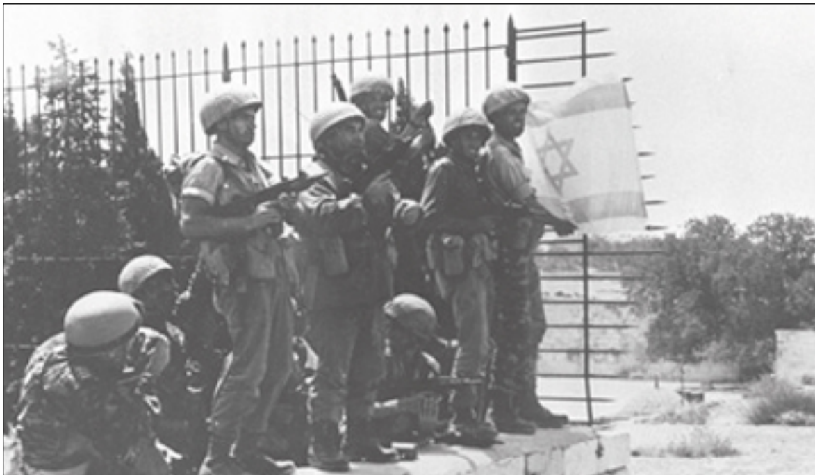
Jérusalem, le 7 juin 1967: des parachutistes israéliens plantent le drapeau national sur le Mont du Temple près d'un grillage surplombant le Mur des Lamentations.

mille Druzes qui, en général, ont une attitude positive envers Israël, comme c'est le cas des Druzes israéliens qui constituent une population loyale à notre égard. Israël s'est donc retrouvé avec une population importante, des gens qui n'étaient pas des citoyens et pour lesquels il fallait trouver une solution dans le but de normaliser les relations. J'estime que ce problème a dans l'ensemble été négligé pendant des années.