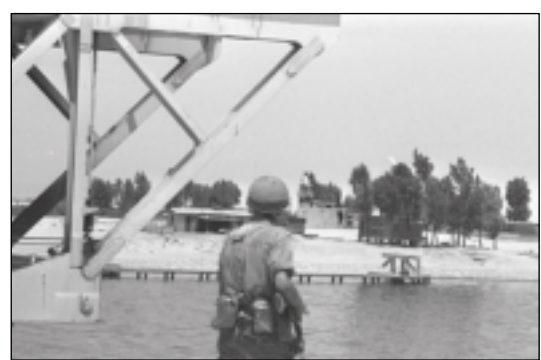
Le 9 juin 1967: un soldat israélien arrive au pont El Firdan qui enjambe le canal de Suez.