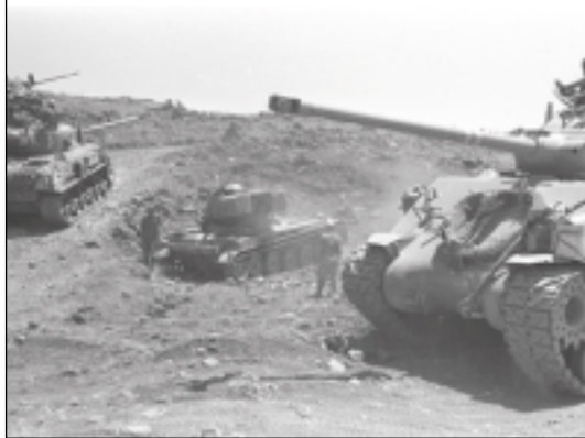
Le 11 juin 1967: des tanks israéliens se fraient un chemin sur le difficile terrain montagneux du Golan.

lants. Après les premières concessions impliquant l'abandon de sept villes en Judée et en Samarie, la seconde Intifada a été déclenchée. Après le désenclavement de Gush Katif et la destruction de 24 villages juifs, le Hamas a été élu haut la main. De nombreuses personnes en Israël ont voulu croire à la formule «territoires pour la paix» et je veux bien penser que certains Arabes palestiniens y croient aussi. Selon certaines sources Abou Mazen en ferait partie, bien qu'il n'ait jamais clairement déclaré à quelle sorte de territoires il fait allusion.