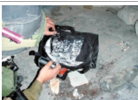
Dieser harmlos wirkende Sack enthielt in Wirklichkeit 5 kg Sprengstoff.

in einem arabischen Dorf befindet. Sie sprechen da aber die grundlegende Frage an, ob Israel wirklich eine Politik der Trennung zwischen der jüdischen und arabisch-palästinensischen Bevölkerung durchsetzen möchte. Wenn ja, drängen sich eine Reihe sehr harter Entscheidungen auf, unter anderem das Verbot für Juden, bestimmte Grabmäler aufzusuchen. Doch da sind wir bereits beim politischen Aspekt der Frage. Ich meinerseits beschränke mich darauf, meine eigenen Sorgen anzusprechen, nämlich das Problem der Sicherheit. Die Lage ist effektiv äusserst gefährlich und man darf unmöglich zulassen, dass die Menschen in den arabischen Zonen frei zirkulieren.