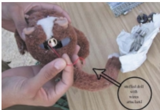
Während einer Intervention in Nablus entdeckte die israelische Armee eine Ladung mit Produkten, die für Terrororganisationen bestimmt war, darunter insbesondere mit Sprengstoff gefüllte Puppen.