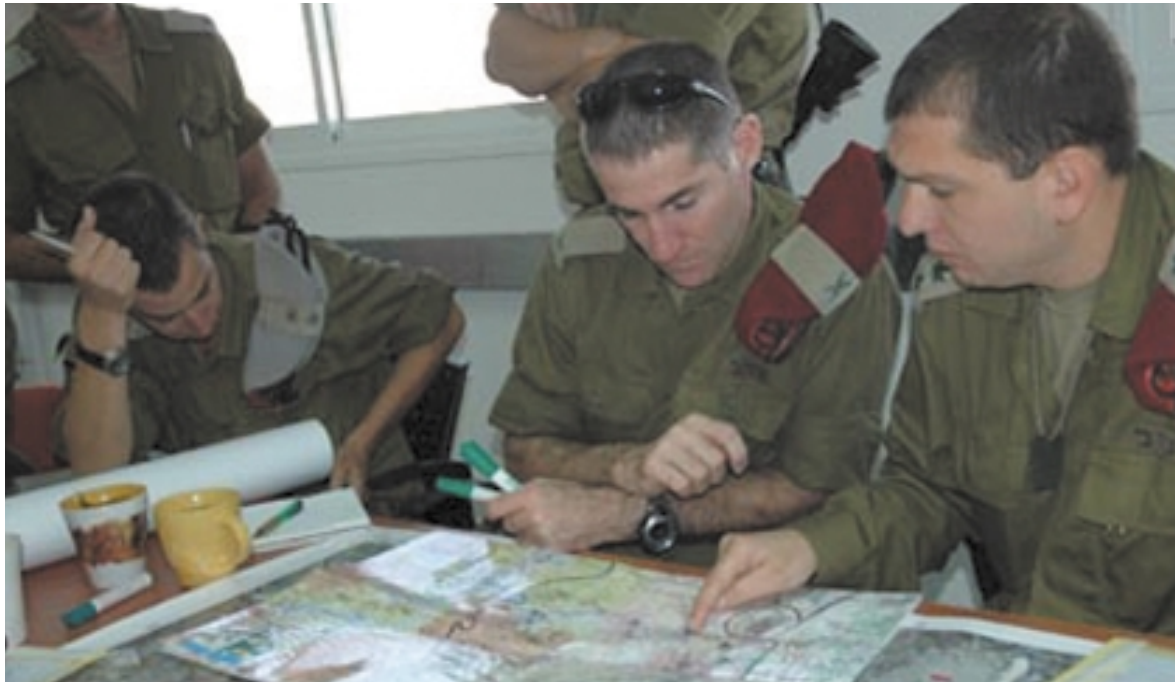
Brigadegeneral Yair Golan, umgeben von seinen wichtigsten Mitarbeitern, bei der Vorbereitung einer antiterroristischen Intervention.

nächster Zeit wieder vermehrt mit leichten Waffen auf zivile Wagen geschossen wird. Zurzeit dürfte meines Erachtens keine radikale Änderung aus den Gebieten selbst eintreffen, die für uns völlig neu wäre oder uns überraschen könnte, auch wenn der Teufelskreis der Gewalt wieder losgehen sollte. Die einzige Entwicklung, die eine Änderung herbeiführen könnte, wäre politischer Art, wie z. B. ein Beschluss der israelischen Regierung, einen grossen Teil der Gebiete in Judäa-Samaria abzutreten und zahlreiche jüdische Dörfer zu evakuieren. Eine weitere Möglichkeit bestünde darin, dass unsere Regierung von den Amerikanern unter Druck gesetzt würde, welche die vollständige und sofortige Umsetzung der berühmten Road Map verlangen. Dies bedeutet kurz gesagt, dass die Sicherheitslage ohne Entwicklung im politischen Bereich wahrscheinlich unverändert bleibt. So herrscht zwar auf politischer Ebene eine grosse Ungewissheit, doch in Bezug auf die Sicherheit kann ich bekräftigen, dass wir die Situation sehr genau unter Kontrolle haben und in diesen Regionen Tag und Nacht auf der Hut sind.