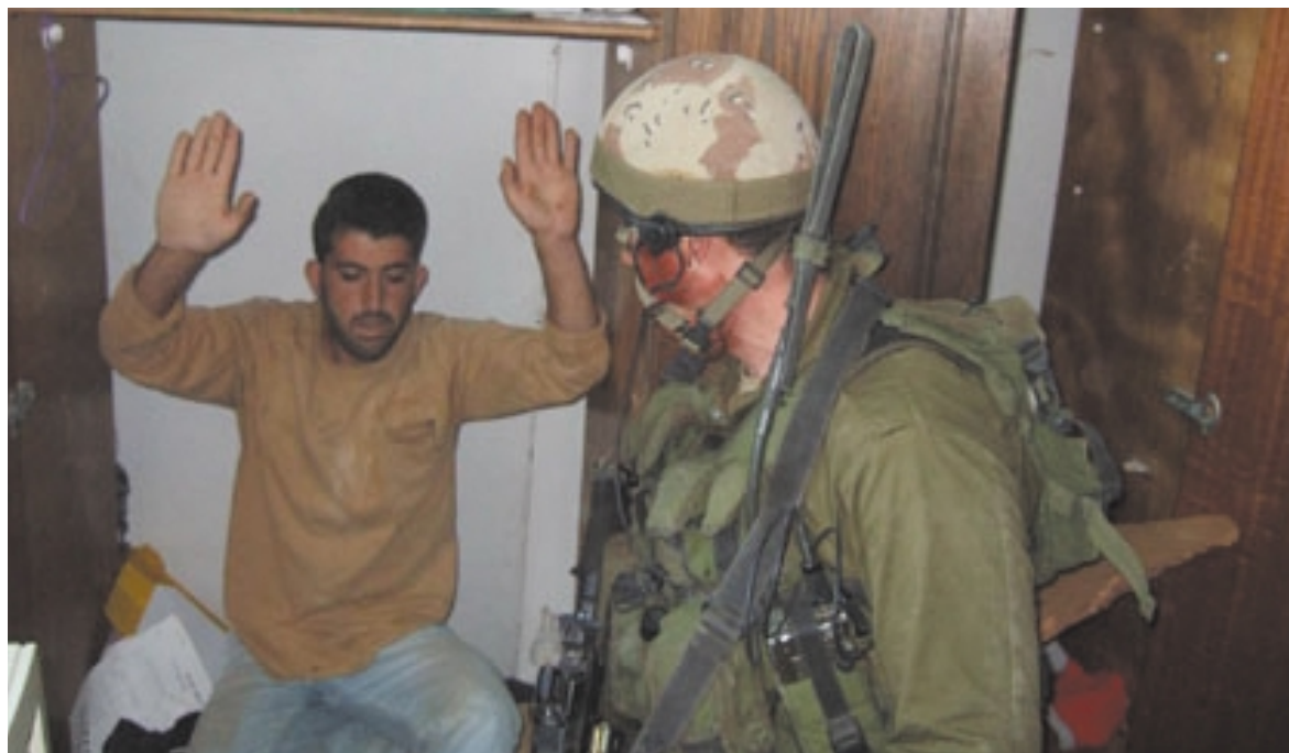
Zahlreiche durch Tsahal in Nablus aufgespürte Terroristen haben Unterschlupf in privaten Wohnungen gefunden und verstecken sich in Schränken mit doppelter Rückwand.

in einem arabischen Dorf befindet. Sie sprechen da aber die grundlegende Frage an, ob Israel wirklich eine Politik der Trennung zwischen der jüdischen und arabisch-palästinensischen Bevölkerung durchsetzen möchte. Wenn ja, drängen sich eine Reihe sehr harter Entscheidungen auf, unter anderem das Verbot für Juden, bestimmte Grabmäler aufzusuchen. Doch da sind wir bereits beim politischen Aspekt der Frage. Ich meinerseits beschränke mich darauf, meine eigenen Sorgen anzusprechen, nämlich das Problem der Sicherheit. Die Lage ist effektiv äusserst gefährlich und man darf unmöglich zulassen, dass die Menschen in den arabischen Zonen frei zirkulieren.