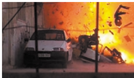
Während der Operation von Februar in Nablus entdeckte Tsahal Sprengstoffladungen mit einem Gewicht zwischen 7 und 10 kg, zahlreiche Sprengstoffgürtel für Selbstmordattentäter und andere Elemente, die für Terroranschläge überall in Israel eingesetzt werden sollten. Das gesamte Arsenal wurde zerstört.

In dieser Hinsicht gibt es grosse Unterschiede zwischen dem Gazastreifen und Judäa-Samaria. In Gaza kann man behaupten, dass sich seit ihrer Wahl die Hamas an der Macht befindet und die oberste Instanz darstellt. Hier in Judäa-Samaria wird die palästinensische Behörde zwar offiziell von der Hamas kontrolliert, doch das Bild sieht ganz anders aus. Wir haben es mit denselben Personen zu tun, die der Fatah entstammen, es ist dasselbe Personal, und meines Erachtens ist auch hier die Fatah an der Macht. In Wirklichkeit kooperieren wir praktisch nicht mit dieser Institution, doch es treten im Alltag kleinere Probleme auf, die wir gemeinsam lösen müssen, wie z. B. medizinische und humanitäre Fragen, Wasser- und Stromversorgung usw. Ausserdem bemühen sie sich ab und