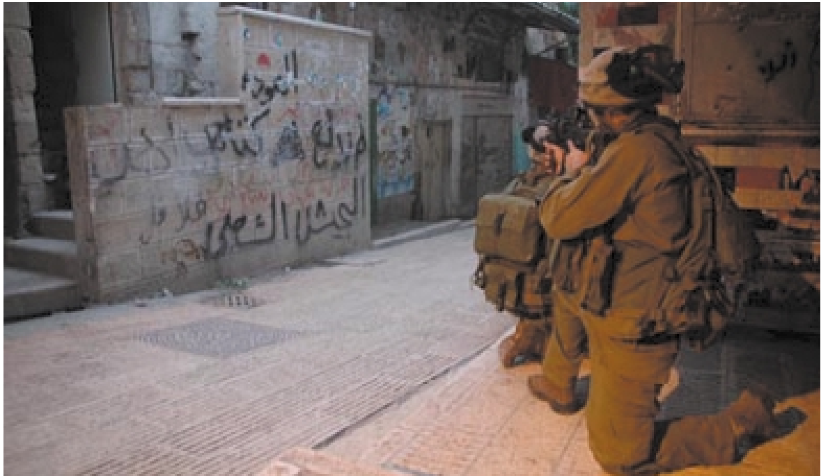
Im Verlauf einer Durchkämpfungsaktion in Nablus stellte Tsahal bedeutende Mengen von Material sicher, das der Herstellung von Sprengstoff dient und für Terroranschläge in Israel vorgesehen war.

zur Verfügung stellt. Man muss jedoch zwischen der Situation in Judäa-Samaria und derjenigen in Gaza unterscheiden. So besitzt zwar die Hisbollah einen gewissen Einfluss hier, hat aber in Gaza völlig freie Hand und spielt eine entscheidende Rolle, da ihre Unterstützung für die Hamas keinerlei Einschränkung unterworfen ist. Dazu ist es interessant zu wissen, dass es keine terroristischen Zellen unter der Leitung der El Kaida gibt. Diese Organisation hat zwei Mal versucht, in der Region Fuss zu fassen, doch wir konnten sie daran hindern.