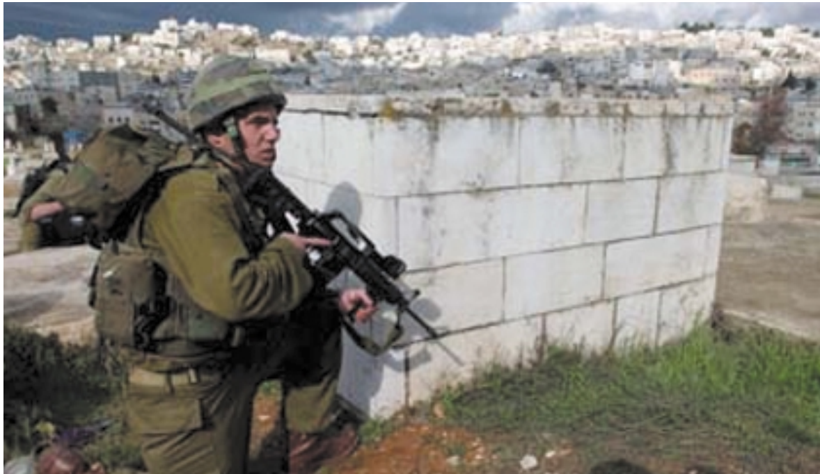
«In Bezug auf die Sicherheit kontrollieren wir dank unserer Präsenz vor Ort die Situation mit grösster Genauigkeit und sind Tag und Nacht in diesen Regionen aktiv.»

Fragen wie z. B. jene, wie sich ein demokratischer jüdischer Staat mit einer bedeutenden arabischen Bevölkerung zu verhalten hat, Fragen betreffend Grenzverlauf, Berechtigung auf diesem Territorium zu leben. Zahlreiche dieser Fragestellungen konnten in den ersten Jahren der Existenz als Staat, d.h. zwischen 1948 und 1973, vernachlässigt werden. Nun stehen wir in einer Phase unserer Geschichte, in der wir uns mit diesen wichtigen Themen auseinandersetzen müssen, und das ist nicht einfach. Es verlangt viel Geduld und viel Weitsicht zu entscheiden, was für uns wirklich wichtig und was zweitrangig ist. Wir müssen in der Lage sein, unser Land mit einer starken und visionären Führung zu versehen. Meiner Meinung nach wird unsere Zukunft durch unsere Fähigkeit bestimmt werden, einen Weg zur Einigkeit in Bezug auf unsere gemeinsamen Werte und Ziele zu finden. Wir müssen uns darüber im Klaren sein, was wir erreichen und wie wir als moderner jüdischer Staat in einer Umgebung leben wollen, deren Werte ganz anders sind als unsere. Es ist entscheidend für uns zu bestimmen, wie wir unsere Zukunft gestalten und wie wir unsere Kinder hier erziehen möchten. Es ist eine schwierige, aber auch machbare Herausforderung und wir werden sie erfolgreich meistern.