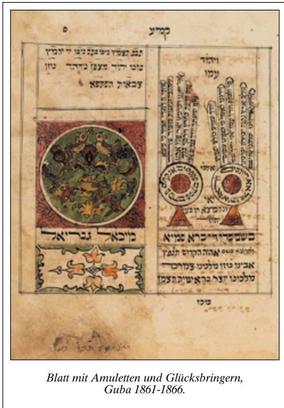
Blatt mit Amuletten und Glücksbringern, Guba 1861-1866.