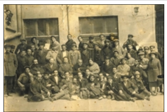
Teilnehmer der gemeindeübergreifenden Konferenz, an der das neue Tat-Alphabet auf dem Programm steht, aufgenommen am 25. April 1929 in Baku.

sowjetische Regime an die Macht. Das Programm für die Erhöhung des Ausbildungsniveaus und des Kulturwissens der Tat-Juden wird aber fortgesetzt. Es werden Schulen mit einem Lehrplan in ihrer Sprache gegründet. An Hochschulinstituten in Baku, Moskau, Rostov und in Zentralrussland dürfen sich junge Tat-Juden ohne Eintrittsexamen immatrikulieren. So entsteht in dieser Gemeinschaft die erste Generation von jüdischen Intellektuellen. Diese positiven Entwicklungen können auf zwei Initiativen zurückgeführt werden, die 1927 und 1929 im Kongress lanciert werden, wobei es sich bei dieser Institution um ein republikübergreifendes Parlament handelt, das einen Lehrplan für die Tat-Juden der gesamten Sowjetunion ausarbeitet. Folgende Beschlüsse werden