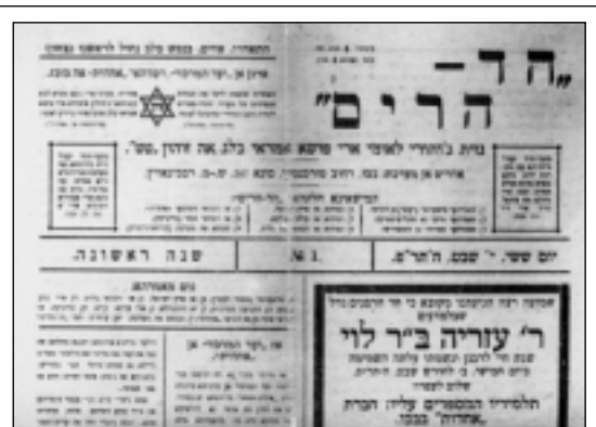
«Hed Harim» - Das Echo der Berge. Zionistische Zeitung, 1920 vom Zentralausschuss der Bergjuden in Baku in der Sprache Jüdisch-Tat herausgegeben und auf Hebräisch gedruckt.

Man kann sich über diese ausserordentliche Veränderung wundern: innerhalb von knapp 15 Jahren - eine extrem kurze Zeit angesichts der Geschichte- erreicht das Volk der Tat-Juden, das während Jahrhunderten