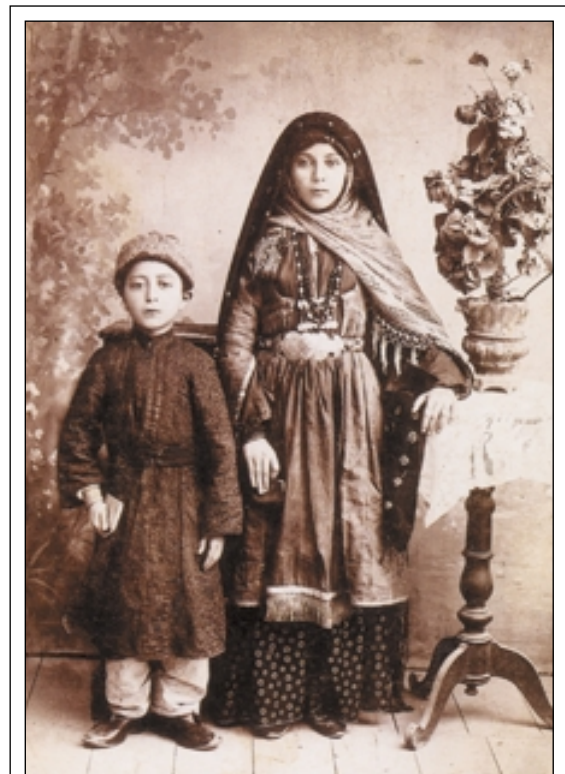
Kinder der Bergjuden in traditionellen Gewändern, Baku 1910.