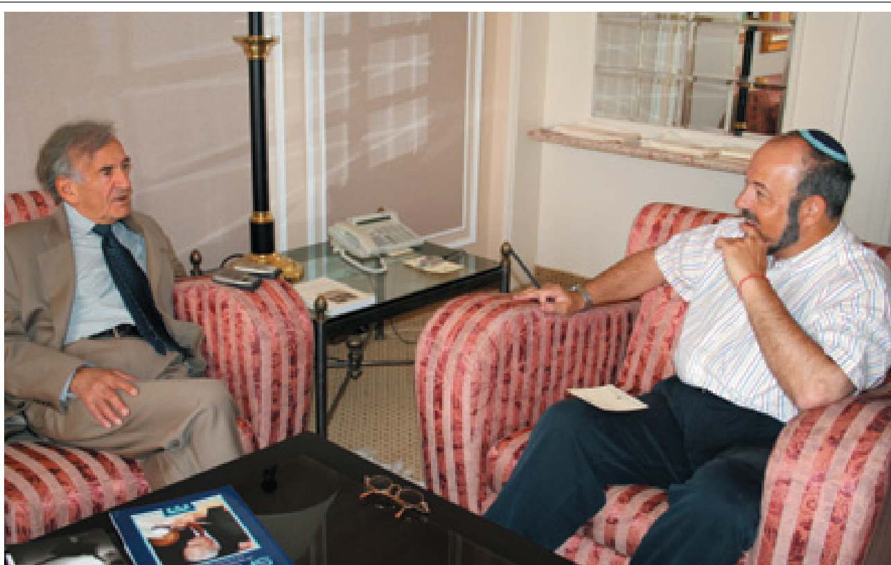
Le professeur Élie Wiesel, Prix Nobel de la Paix 1986 et auteur de plus de 40 livres, a reçu le rédacteur en chef de SHALOM à Jérusalem pour une interview exclusive.