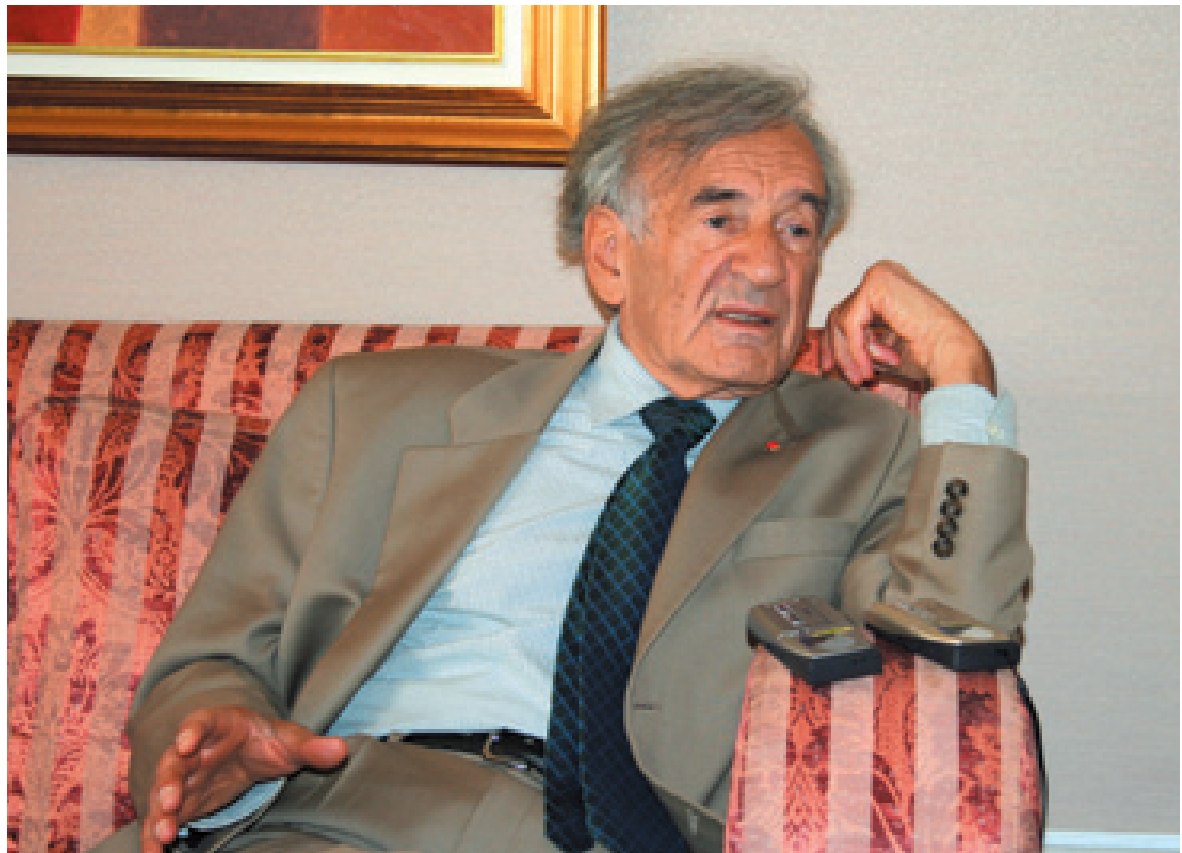
«Le plus grand danger auquel nous sommes actuellement confrontés est un problème à la fois mondial et juif: le fanatisme.»

ques, des journaux, et cela à tous les niveaux, y compris gouvernemental. L'autre danger, qui est parallèle, réside dans le fait que dans la Diaspora, nous manquons cruellement de dirigeants. Voyez-vous, pour former des dirigeants, il faut plusieurs générations. Or les leaders d'aujourd'hui ont été assassinés pendant la Shoah, à l'âge de 2 et 3 ans. Le monde n'a pas encore saisi les résultats et les conséquences de ce qui s'est passé. Des grands responsables comme par exemple le Gaon de Vilna ou le Besht (fondateur du hassidisme) ne se sont pas faits en un jour. Ils étaient le résultat d'une longue formation qui s'est étendue sur au moins une génération. Nous commençons à ressentir l'absence, l'absence due à la mort parce que l'on a tué ces enfants.