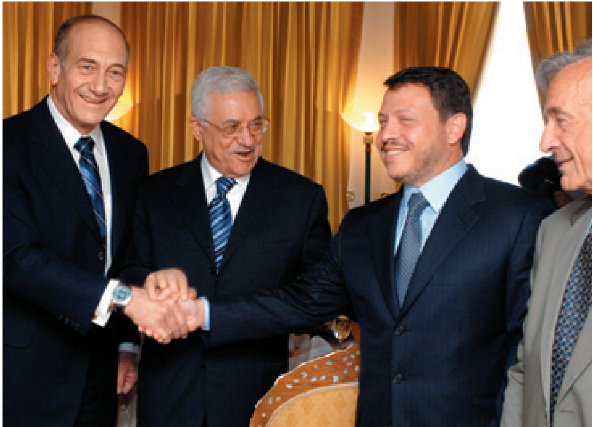
Rencontre à Pétra, lors de la conférence des Prix Nobel organisée par la «Elie Wiesel Foundation for Humanity» en juin 2006.

voilà dans un pays souverain. La souveraineté dans l'histoire juive n'a jamais été très longue, elle n'a jamais dépassé 80 ans, toujours en état d'urgence, menacée de toutes parts par les Babyloniens, les Romains, les Perses, etc. Aujourd'hui, nous avons un État fort et même riche. Lorsque l'un des plus grands financiers du monde décide d'investir quatre milliards de dollars en Israël, cela constitue une preuve de confiance indéniable. Psychologiquement, nous aurions dû être une génération morbide, il y avait assez de raisons pour cela. Après la destruction du Temple, nous l'étions. Or aujourd'hui, ce n'est absolument pas le cas. Il y a beaucoup de grandes choses qui se passent dans de nombreux domaines. Sur le plan militaire, Israël a fait des découvertes qui suscitent l'envie des grandes puissances. Sur le plan économique, scientifique et politique, aujourd'hui, en particulier en Amérique, les Juifs ont atteint des positions au plus haut niveau. Finalement, en Israël, nous avons connu l'attribution de quatre Prix Nobel d'affilée. De plus, tout le centre de la vie intellectuelle juive est à Jérusalem. Il y a beaucoup plus de yeshivoth aujourd'hui en Israël qu'il n'y en a jamais eu dans toute l'histoire. Bien entendu, il existe un autre côté, l'assimilation, qui, selon moi, ne représente pas un vrai danger pour nous. La question des mariages