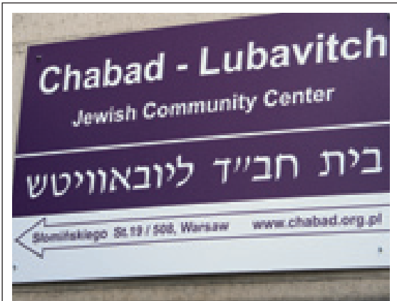
Le centre Chabad offre de nombreuses activités, dont un restaurant cachère, un business center, un Talmud Torah, etc.

nous sommes installés ici il y a environ un an et demi. Il faut savoir qu'en Pologne, il existe encore de nombreuses personnes qui savent qu'elles sont juives mais qui ont peur de le révéler en raison de l'antisémitisme de leurs voisins. Elles ont souvent été traumatisées par la Shoah ou par le communisme. Lorsque je vous parle de renforcer l'identité juive, nous le faisons avant tout par le biais de cours, de conférences, d'activités culturelles, de clubs pour les aînés, les jeunes et les enfants. Certaines personnes viennent chez nous uniquement pour parler, rencontrer quelqu'un où échanger des idées. Nous avons aussi un Talmud Torah où, chaque dimanche, nous recevons de nombreux enfants israéliens qui fréquentent des écoles américaines ou britanniques et dont les parents vivent en Pologne pour des raisons professionnelles. En général, lorsque ces enfants viennent chez nous, bien que leurs parents soient israéliens, ils ne savent même pas lire la première lettre de l'alphabet. Nous avons développé cette activité à travers toute la Pologne.