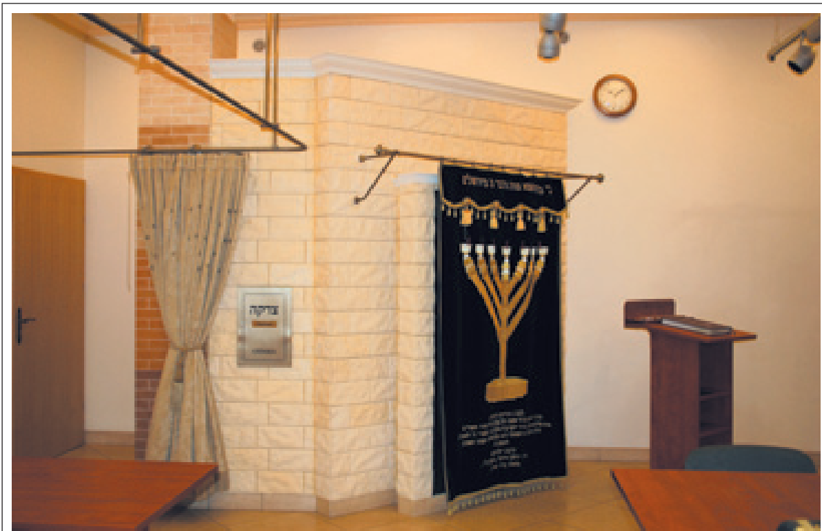
L'activité de Chabad s'adresse avant tout aux Juifs étrangers qui travaillent en Pologne.