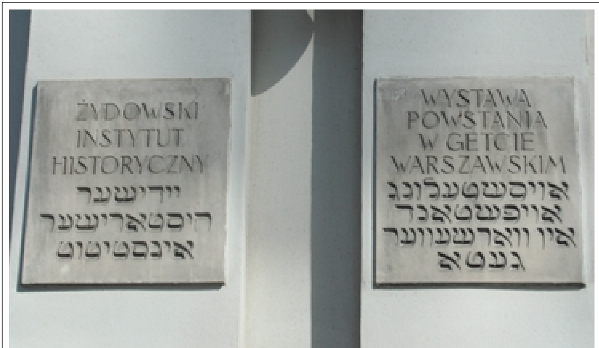
Das Jüdische Historische Institut in Warschau sichert die Erinnerung an das Leben und die Kultur der Juden vor dem Krieg und an ihre Vernichtung innerhalb kürzester Zeit während der Schoah.

Warschau besitzt kein jüdisches Museum im eigentlichen Sinne. Im Rahmen des Jüdischen Historischen Instituts erhält man allerdings dank einer ständigen Ausstellung in zwei Teilen einen knappen Überblick über das, was das jüdische Leben in Polen einmal darstellte.