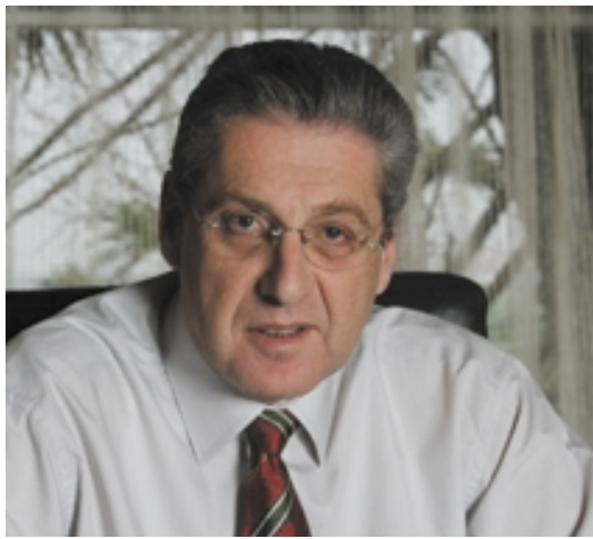
Le Dr Ehud Ganani, président de la société TraceGuard Technologies Inc.

nant actuellement dans les aéroports. Le bagage est isolé et recouvert d'un plastic compact de manière à ce que tous les résidus de la taille d'une poussière minuscule puissent être aspirés par les trous microscopiques que nous faisons dans le bagage. C'est en fait le vieux système des femmes de ménage pour sortir la poussière d'un oreiller. Les résidus sont alors immédiatement détectés et analysés, qu'il s'agisse d'explosifs ou de drogues. En d'autres termes, par des méthodes non invasives et non destructives, notre technologie permet d'extraire des échantillons microscopiques de particules ou de vapeurs provenant de substances suspectes. Ce même système peut être appliqué au petit volume du bagage à main, mais aussi aux valises, à des voitures et à des grands ensembles de palettes de fret. Ainsi, dans un envoi de 2.5 tonnes, nous pouvons découvrir une quantité de résidus équivalents à la taille d'une empreinte digitale. Toute cette opération dure moins de vingt secondes. De plus, notre technologie a été étudiée pour être intégrée dans les systèmes de détection déjà installés. Il faut bien comprendre qu'aucune machine ne peut remplacer l'intervention humaine, mais celle-ci réduit à chaque station de contrôle la présence de sept personnes à trois. N'oublions pas que le moyen le plus efficace pour combattre le terrorisme réside dans les contacts interhumains et dans l'évaluation rapide de l'interlocuteur et de son attitude.