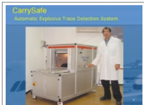
Le système automatique de détection de traces d'explosifs de TraceGuard, «Carry Safe», peut être intégré dans les appareils de contrôle des bagages déjà existants dans les aéroports.

concerne notre manière opérationnelle de travailler, je vous donnerai l'exemple des questions que l'on pose à chaque voyageur lorsqu'il passe le contrôle de sécurité. Il y a dix ans, nous étions les seuls au monde à procéder ainsi or aujourd'hui, on retrouve cette démarche dans le monde entier. En raison de notre confrontation quotidienne et de longue date avec le terrorisme, nous avons été amenés à développer de nouvelles technologies de protection. A ce jour, il y a environ 150 sociétés en Israël dont l'activité est de mettre au point des instruments permettant de mieux protéger les personnes et les biens. Israël est innovateur dans ce domaine comme dans de nombreux autres, il suffit d'ailleurs de jeter un coup d'œil sur le Nasdaq pour constater qu'après les sociétés américaines et canadiennes, ce sont les compagnies israéliennes qui sont les plus représentées à cette bourse. TraceGuard Technologies Inc. est également traitée au Nasdaq sous le sigle: TCGD.OB .