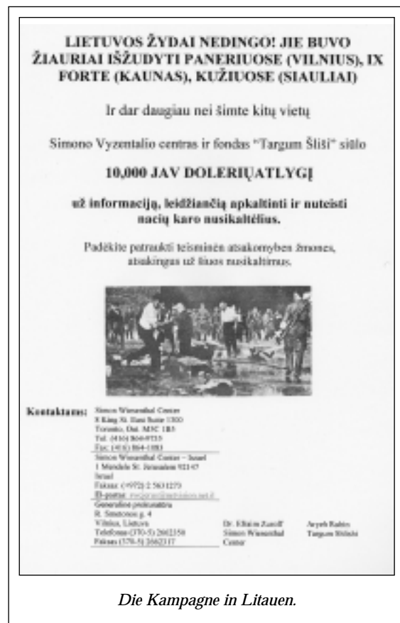
Die Kampagne in Litauen.

Im ersten Jahr ihrer Durchführung erhielt die Operation letzte Chance die Namen von über 200 Verdächtigen, die meisten von ihnen aus Litauen. Durch diesen Erfolg ermutigt, beschlossen die Initianten des Projekts, es im September 2003 auf Polen, Rumänien und Österreich auszudehnen. Wir haben uns für eine Linie entschieden, gemäss der wir unsere Bemühungen ausschliesslich auf die Länder konzentrieren, in denen die ansässige Bevölkerung und/ oder die Regierung (z.B. Rumänien) sich aktiv an der Vernichtung ihrer jüdischen Gemeinschaft oder der Ermordung von Juden anderer Nationalitäten beteiligt hatten. In den baltischen Staaten ist diese Kollaboration allgemein be-