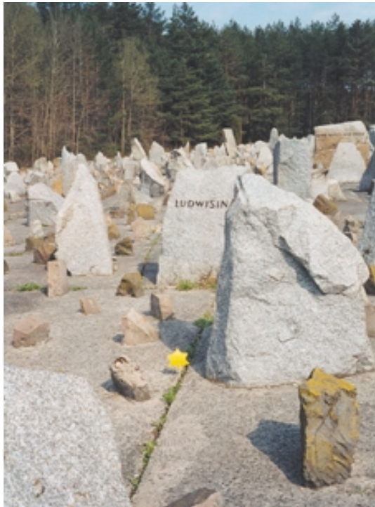
Treblinka. In Polen ist die lokale Kollaboration mit den Nazis unbestraft geblieben.

von Anrufen antisemitischen Inhalts überflutet. Von rund 100 Anrufen stammten über 90 von Personen, die nur ihre eindeutig antisemitische (und oft antiamerikanische) Meinung ausdrücken wollten. Meist erklärten sie, Bush und Sharon seien die «eigentlichen Kriegsverbrecher», und sie forderten eine finanzielle Entschädigung! Andere schickten ähnliche Kommentare an unser Büro in Jerusalem, zusammen mit einer Kopie der Anzeige, die wir unter dem Titel «Die Mörder sind unter uns» im Boulevardblatt Kronen Zeitung veröffentlicht hatten. Eine Frage tauchte in vielen Anrufen, Briefen und E-Mails immer wieder auf: Wann werden die Juden aufhören, uns aufgrund der Vergangenheit auszunutzen?