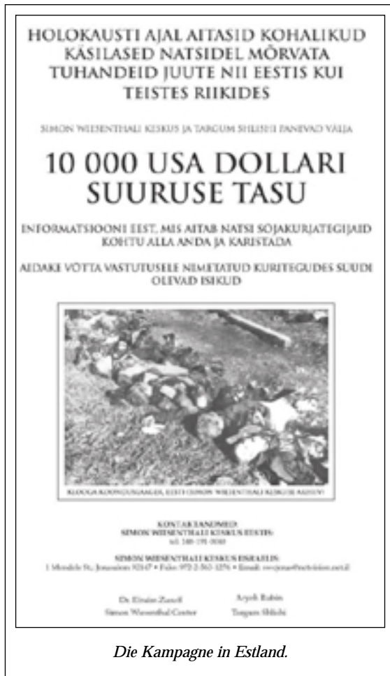
Die Kampagne in Estland.

Neben der versprochenen Belohnung von $.10'000 listete die Anzeige die Telefonnummern der ansässigen jüdischen Gemeinde, des mit der Untersuchung der Verbrechen totalitärer Regimes beauftragten Staatsanwalts (Verbrechen der Nazis und der Kommunisten) sowie des israelischen Büros des Wiesenthal Centers auf.