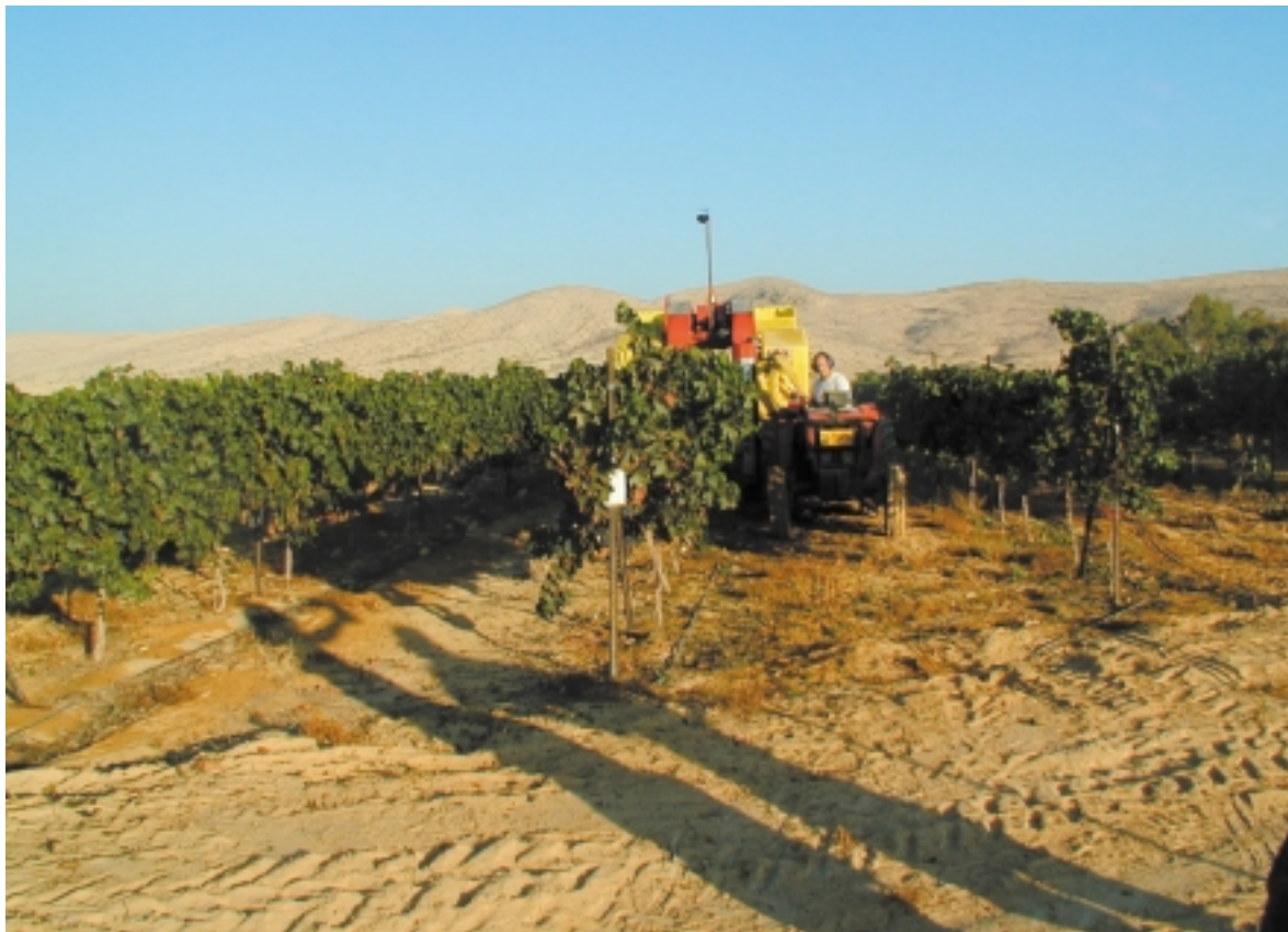
La région de «Ramat Negev» a développé une agriculture et une pisciculture particulièrement riches et variées.

tées par des bédouins. Nous avons également constaté qu'il s'agit d'une population qui se dédouble tous les dix ans. Si cela continue, un calcul facile nous permet de savoir où ils en seront en 2020 ou 2030 ! C'est là l'une de nos grandes préoccupations et j'en reviens à mon idée première qui veut que le seul moyen de sauver le Néguev soit de concevoir un programme qui encouragera un million de Juifs à venir s'y installer. Nous y travaillons et mettons tout en œuvre afin que le gouvernement nous apporte son aide.