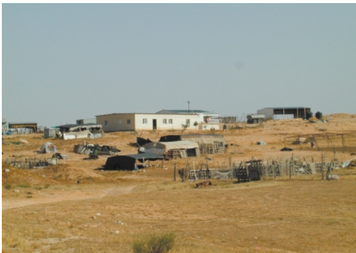
Aussi bien dans le Néguev qu'en Galilée, les bédouins se sont installés dans des milliers d'habitations illégales.

taller dans notre région. Je pense que la société religieuse en Israël est à la recherche de nouveaux défis. J'estime que le peuplement du Néguev constitue l'un d'entre eux. Il peut être assez facilement réalisé car il n'y a aucune opposition politique à ce sujet, bien au contraire. Dans cet esprit, j'ai créé un nouveau village religieux, «Rechavam», qui aujourd'hui compte 25 familles et 75 autres devraient les rejoindre d'ici la fin de l'année. Nous avons prévu de loger un total de 300 familles à Rechavam. Le village a été nommé en souvenir du ministre israélien assassiné par des Arabes, Rechavam Zeevi (dit Ghandi), car nous avons commencé les travaux de déblaiement le jour de son enterrement.