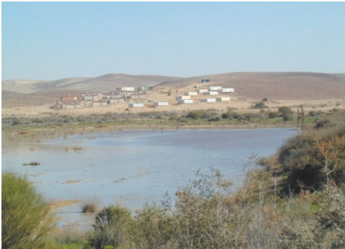
Le nouveau village de Rechavam devrait accueillir 300 familles juives.

le fait qu'ils squattèrent des terres gouvernementales et ce avec une agressivité telle que la police a peur d'entrer dans certaines zones; le troisième concerne l'environnement et les questions d'hygiène qui ne constituent pas leur souci premier. De nombreux accidents de voiture sont provoqués par des chameaux qui se promènent librement sur les routes et les exemples sont nombreux. Il faut bien comprendre que tous ces bédouins ont des passeports israéliens et peuvent donc être considérés comme des citoyens à part entière, en rupture de la loi. Parallèlement, lorsqu'une maison construite illégalement est détruite, elle est reconstruite en moins de 24 heures. A cela s'ajoute le fait que grand nombre de ces bédouins ont des liens intimes avec les mouvements islamistes les plus extrémistes qui existent en Israël. De plus, leur installation est faite de manière très astucieuse. En effet, vu de loin, ils vivent dans des tentes provisoires. Or sous les toiles de ces tentes, ils ont construit de véritables maisons en dur avec une arrivée d'eau, des toilettes, etc.