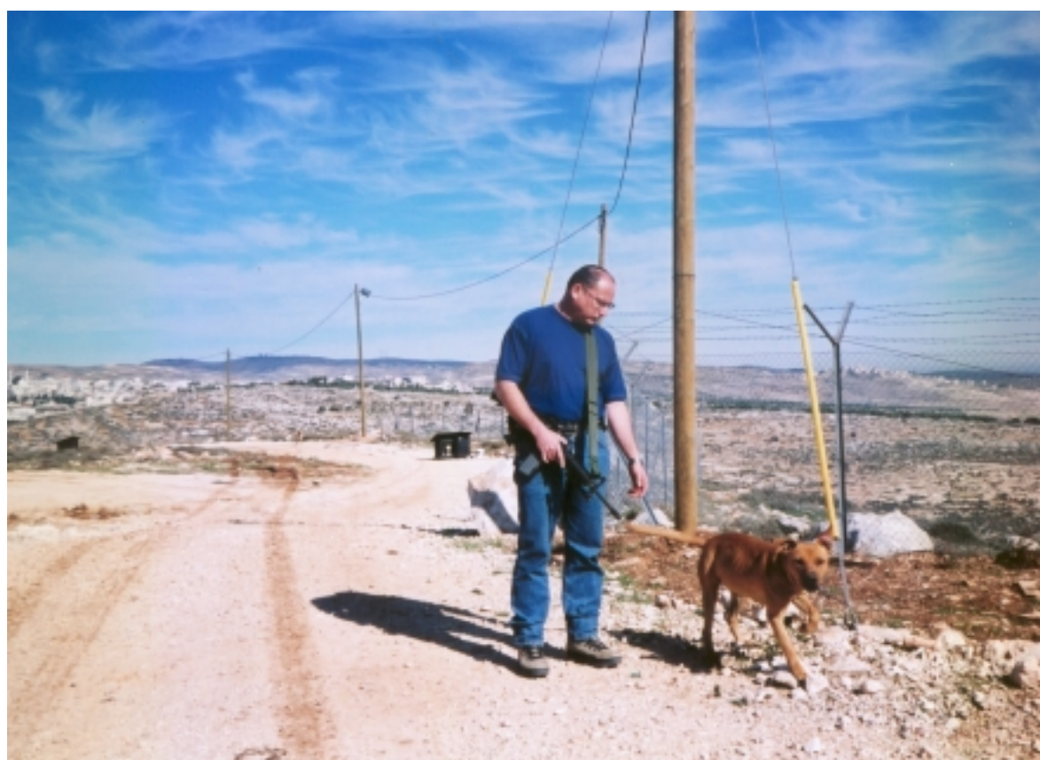
Chaque famille possède un chien dressé spécialement pour la garde.

suffisamment de familles à Migron pour assurer un minyan.