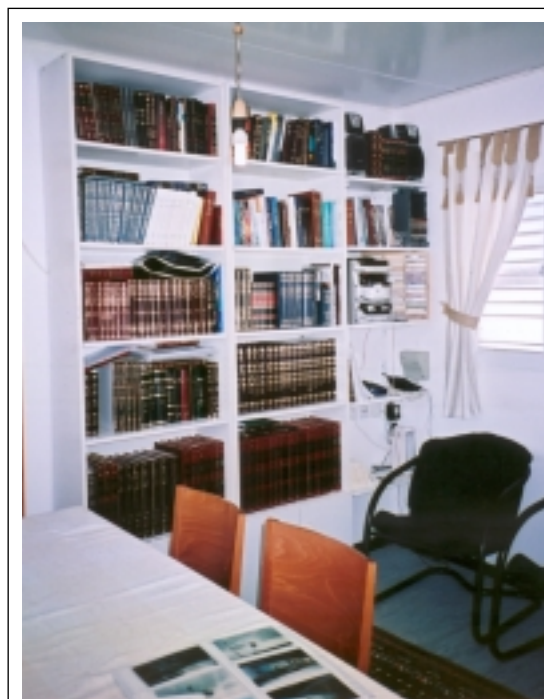
Intérieur d'une caravane.

Lorsque l'on se trouve à Migron, un rapide coup d'œil suffit pour comprendre l'importance stratégique du site. En effet, chaque angle couvre une route de première importance qui mène à Jérusalem. Le village s'intègre totalement dans un groupe d'autres points de peuplement juifs qui entourent Jérusalem, constituant ainsi une bague de protection autour de la capitale de l'État juif. A ce jour, ce «cercle» est presque totalement fermé. Migron a été construit sur des terres gouvernementales, sans expropriation d'aucune famille juive ou arabe. De plus, il est important de souligner qu'en établissant Migron, les autorités régionales ont voulu accroître la présence juive afin que les villages juifs de Samarie ne puissent jamais être isolés au cas où, dans le cadre d'un accord global, certaines régions devraient encore être soumises à l'autorité de l'OLP. A cet égard, il est intéressant de noter que la fameuse «feuille de route» du Quartet stipule que tout nouveau point de peuplement juif créé après janvier 2001 devra être démantelé au plus tard le 1 er mai 2003... Il est bien entendu que cette proposition ne sera jamais appliquée. Toute «l'opération Migron» est une réalisation de pionniers et les jeunes responsables que nous avons