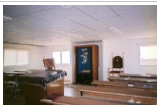
Selon la tradition juive, l'une des premières constructions est consacrée à l'étude et à la prière.

rencontrés dans le village nous ont fait comprendre que pour eux, le défi était d'autant plus important qu'il comportait un élément de nouveauté, sortant des sentiers battus. Ceci est d'autant plus vrai que chaque installation de caravane est un véritable tour de passe-passe doublé d'acrobatie. En effet, en raison des pressions internationales, le gouvernement ne peut pas permettre un développement ouvert et officiel de Migron. C'est pour cela que l'armée a pour instruction d'intercepter tout transport de caravanes vers le village. Ne pouvant pas être livrées en pièces détachées et assemblées sur place, elles doivent voyager pour ainsi dire terminées. Les promoteurs de Migron acheminent donc leurs caravanes la nuit par