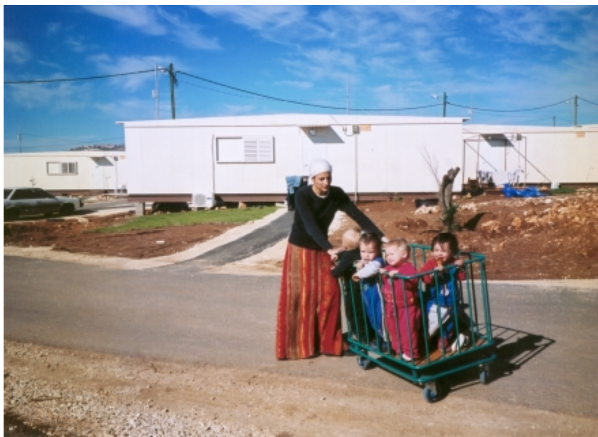
Le peuplement rapide de Migron est une nécessité absolue.