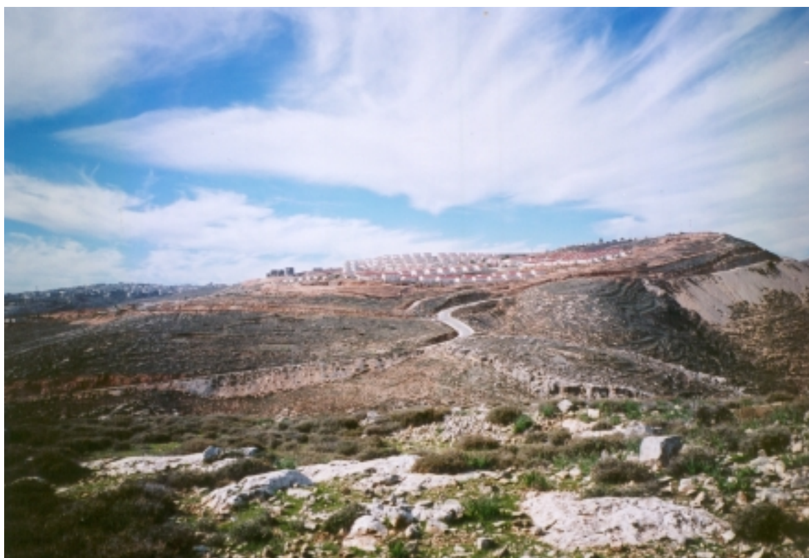
Migron est situé sur une colline qui permet de contrôler une bonne partie des routes principales qui relient la vallée du Jourdain, le nord et le sud du pays à Jérusalem. D'énormes étendues permettront à Migron de se développer rapidement et de devenir ainsi partie intégrante de Jérusalem.

plan, celui de la multiplication de la présence effective sur le terrain.