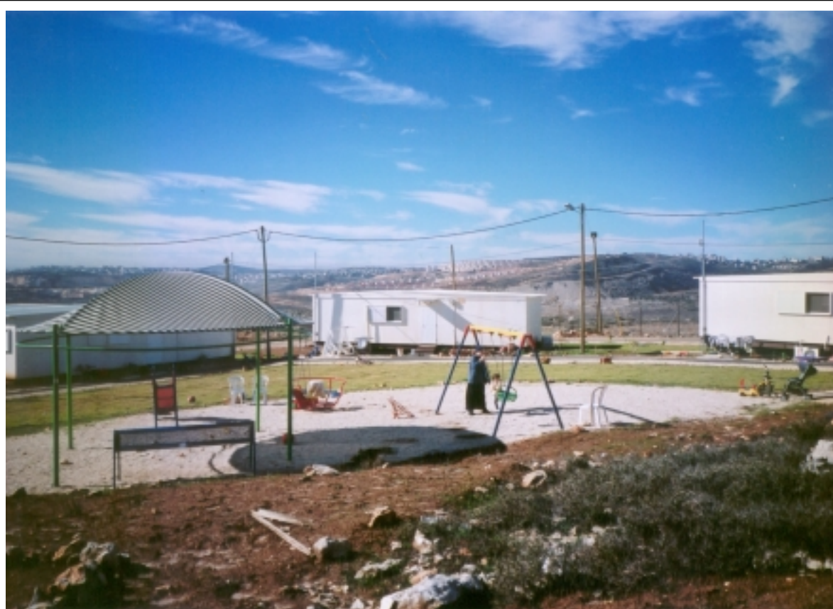
Des initiatives comme la création de Migron sont une énorme source d'optimisme et d'espoir.