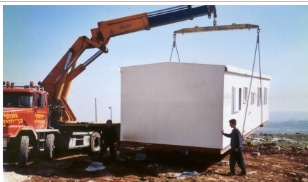
Une première étape de construction de 500 logements est prévue.